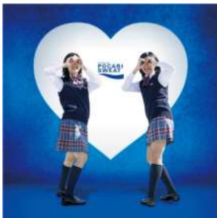
撮影写真イメージ

まるで写真館のような背景や椅子の置かれたフォトスペースで、自由に撮影いただけます。どなたでも無料で参加できます。撮影した写真は、撮影後発行される2次元コードレシートからダウンロードできます。