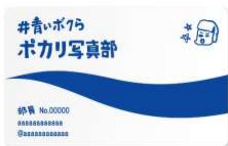
「ポカリ写真部」部員証