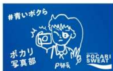
「ポカリ写真部」特製ステッカー