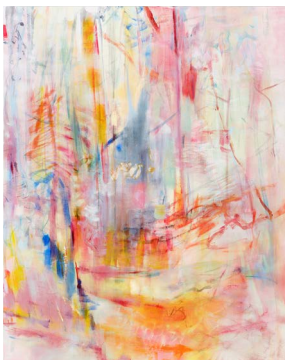
06 (View, Following the Trees, Morning 16 Jan 2022) 2022年 / H227.5×W182cm キャンバスに顔料、アクリル、その他