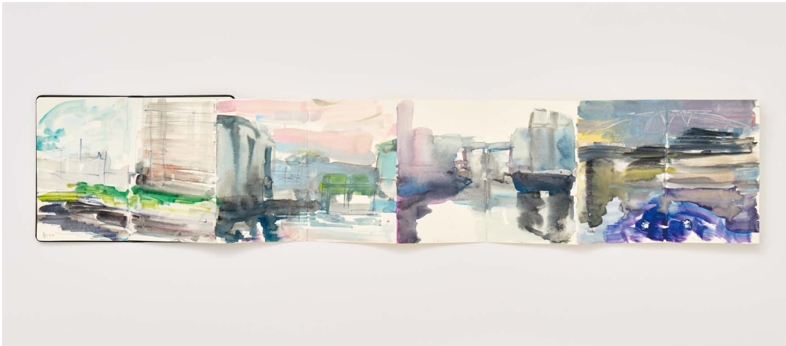
(Sketchbook No.184) / 6:50pm, 6:55pm, 7pm, 7:05pm, 14 Jun 2024) 2024年 / H14×W72cm / 鉛筆・水彩・色鉛筆、紙