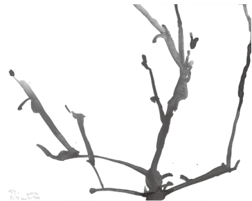
08 (柿, 5:55pm 2023 20 Feb) 2023年 / H19.3×W24.5cm / 鉛筆・水彩、紙 ©Miyuki Tsugami